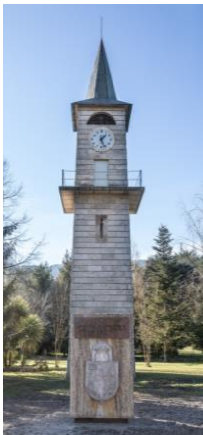
Banyoles, "Casa Nostra" Torre de la Esperança

100 ANYS DE L'INICI DE L'APOSTOLAT DE MAGDALENA AULINA 1916 - 2016